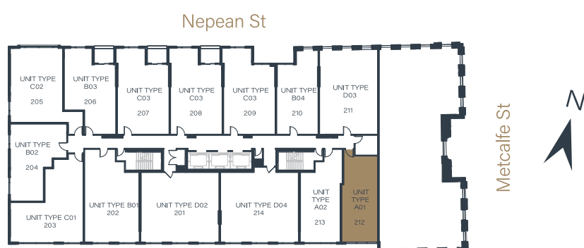
2ND FLOOR 2ND ÉTAGE